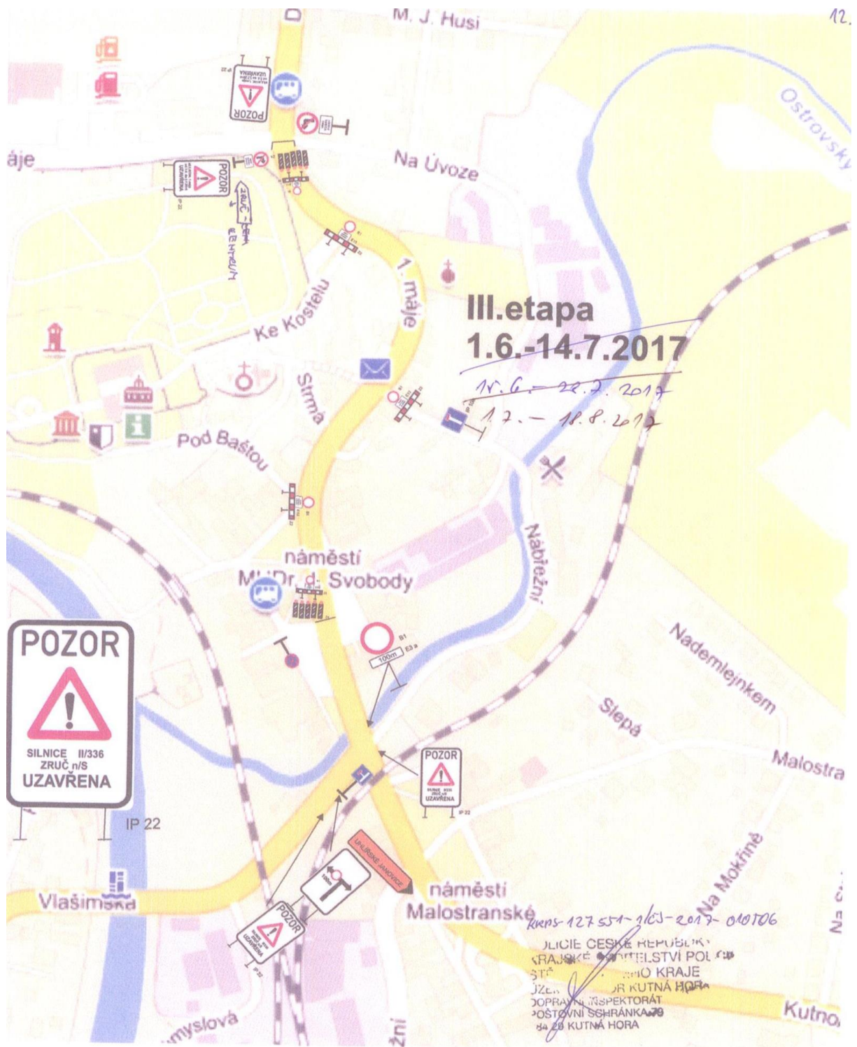
Při opravě vozovky v ulici 1.máje je po domluvě s autobusovým přepravcem částečně vyparkováno náměstí MUDr. J.Svobody (viz.zprava)a detail